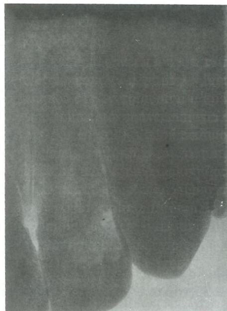
Figura 1-b - La radiografía muestra la extensión del área de destrucción dentaria.

En virtud de la indefinición del diagnóstico, se optó por la realización de un examen quirúrgico. Realizada la anestesia, se procedió a la técnica de cirugía gingival (fig. 2), que tiene doble finalidad: la primera, exponer el área de destrucción dentaria, proporcionando forma de conveniencia adecuada para el procedimiento restaurador subsiguiente y, la segunda, para encaminar el tejido excisado al examen histopatológico. El procedimiento quirúrgico elegido fue la cuña interproximal 7 . La incisión fue hecha con una lámina de bisturí No. 15 (fig. 2A), colocada dentro del surco gingival, paralelamente a la superficie externa del diente en cuestión. Después de la incisión (fig. 2B), el tejido gingival interproximal y el tejido que ocupaba la cavidad dentaria fue removido con una cureta e inmediatamente inmerso en formalina y llevado para examen histopatológico. Con el área de destrucción dentaria ahora totalmente expuesta, se puede constatar ser un proceso cariado cervico-proximal invadiendo la superficie vestibular sin destrucción de la misma y a través de la cual ocurrió la hiperplasia del tejido gingival. En seguida se procedió al aislamiento absoluto del campo operatorio, remoción del Tejido cariado, definición de la